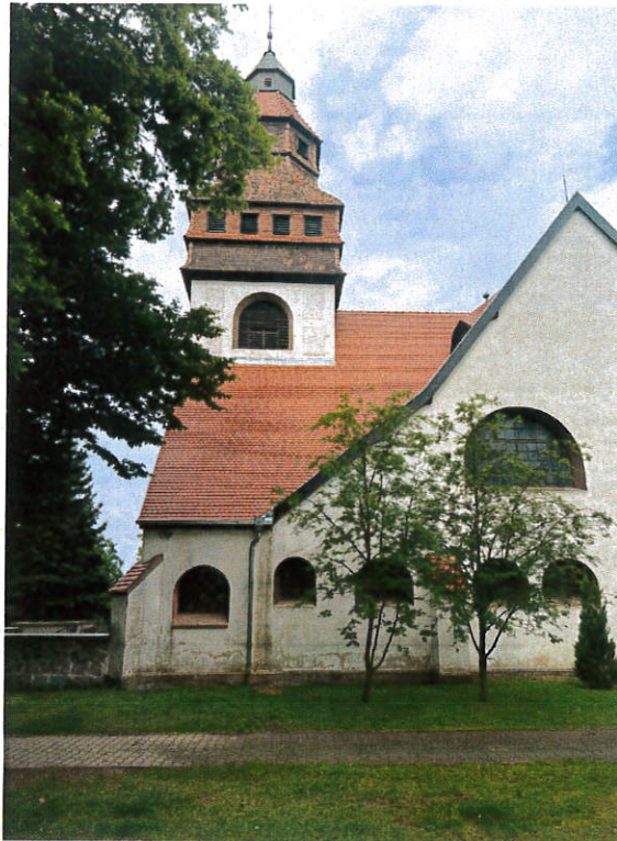
Remonty dachu Cerkwi pw. Zwiastowania Najświętszej Maryi Bogarodzicy w Malczycach