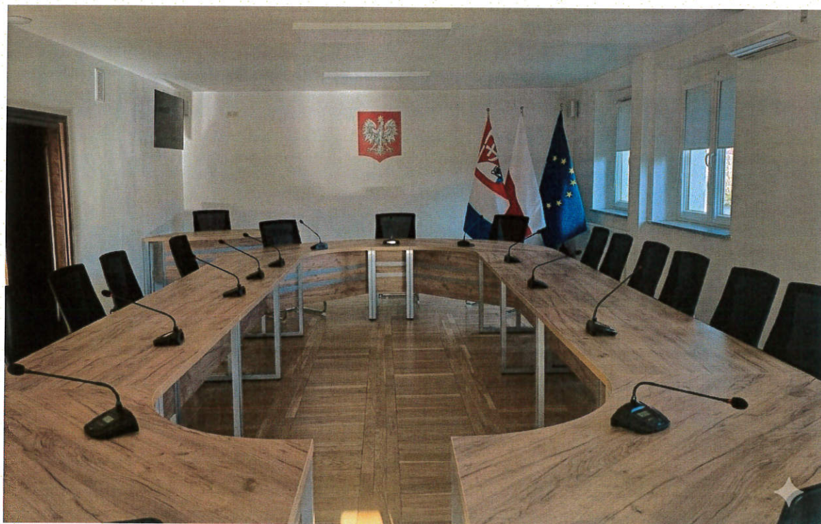
Modernizacja wnętrza Urzędu Gminy Malczyce