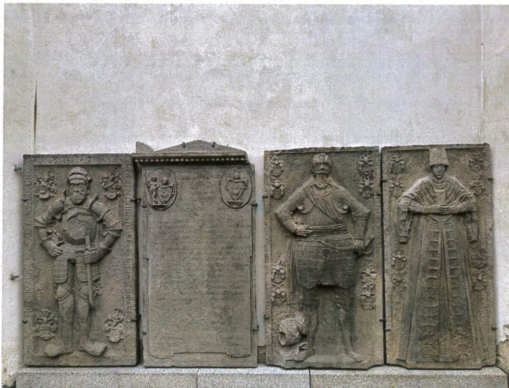
Remont elewacji kościoła pw. św. Jadwigi w Dębicach