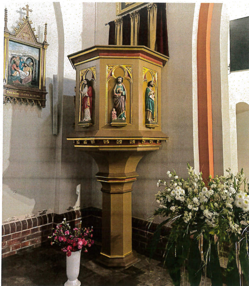
Renowacja ambony w kościele pw. Niepokalanego Poczęcia NMP w Malczycach